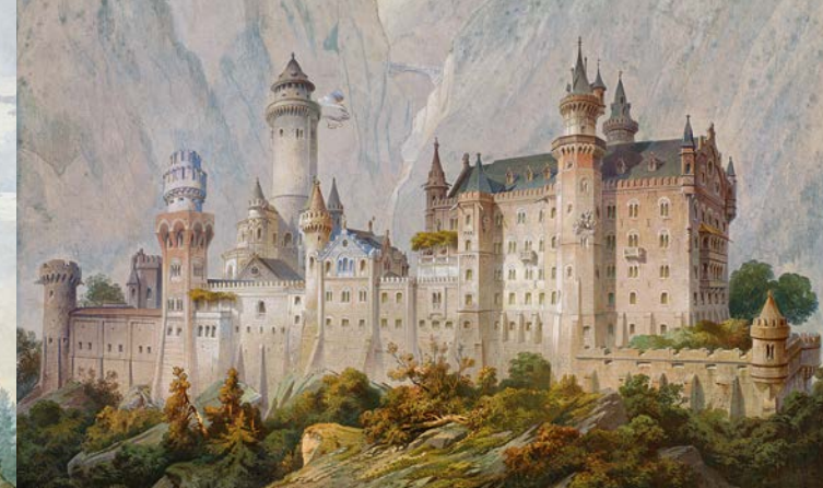
Nicht ausgeführter Idealentwurf für Schloss Neuschwanstein, 1869 von dem Theatermaler Christian Jank geschaffen (WAF), Ludwig II.-Museum