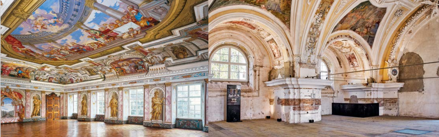
Der Kaisersaal diente als Fest- und Speisesaal. Die illusionistische Wand- und Deckenmalerei stammt von Benedikt Albrecht (1715).