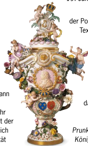
Prunkvase mit Reliefbüste König Ludwigs XIV. von Frankreich

Seit 1878 ließ Ludwig II. auf der Herreninsel ein Abbild des Schlosses Versailles als »Tempel des Ruhmes« für den »Sonnenkönig« Ludwig XIV. von Frankreich errichten, also ein Denkmal des absolutistischen Königtums ohne praktische Funktion. Der Architekt Georg Dollmann musste das Vorbild studieren und auch Räume rekonstruieren, die in Versailles längst nicht mehr bestanden. Die Haupträume sind der Höhepunkt der Ausstattungskunst des 19. Jahrhunderts, ungleich prunkvoller als in Versailles. Die Fülle und Qualität