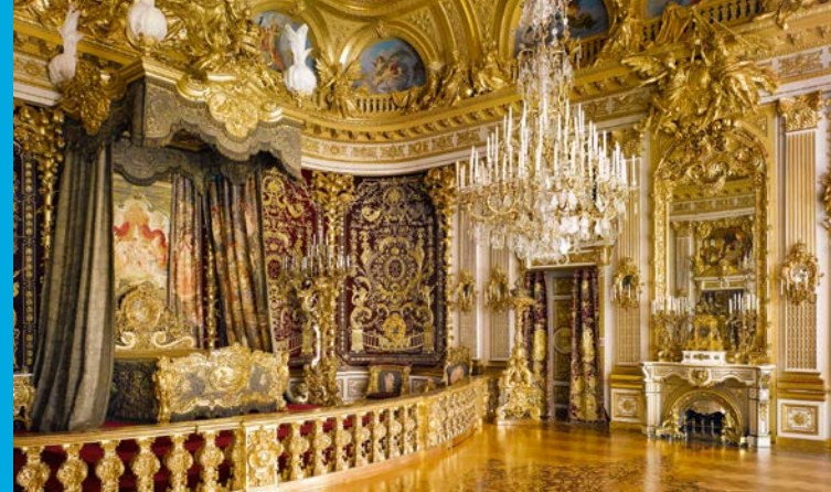
Paradeschlafzimmer im Großen Appartement, im Stil Ludwigs XIV. von Frankreich. Der teuerste Raum des 19. Jahrhunderts wurde 1879–1881 geschaffen