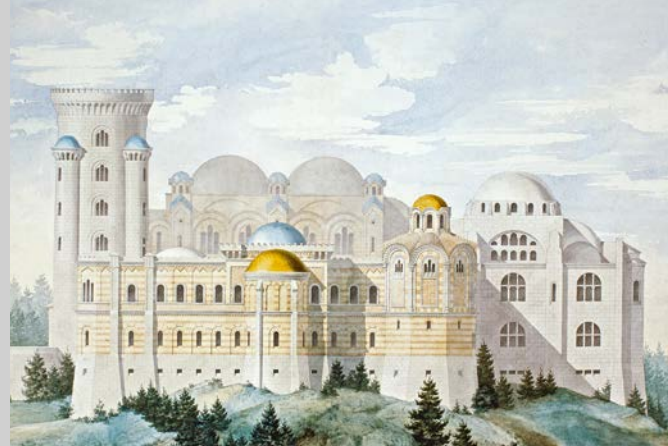
Entwurf eines byzantinischen Palastes, Aquarell von Julius Hofmann, 1885; Tagebuch König Ludwigs II. mit Gralstempel (Mitte), beide Ludwig II.-Museum